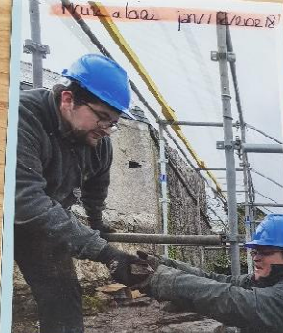
Travaux de reconstruction au sein de la Régie de Quartiers.

Monsieur le Directeur... Elle sera chargée de l'entretien des espaces verts et de la gestion des déchets.