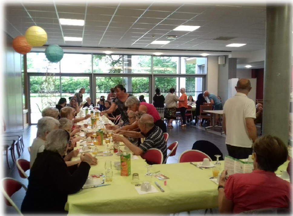
Petit Déjeuner Vitaminé au Centre Robert Robin le Jeudi 21 Juin 2018